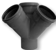
HTED Rohová odbočka DN 50/50/50-75/75/75 110/50/50-110/110/110 α 45°-67°30'