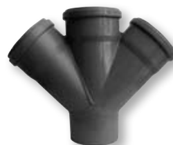
HTDA Dvojitá odbočka DN 50/50/50-75/50/50 75/75/75-110/50/50 110/75/75-110/110/110 α 45°-67°30'-87°30'