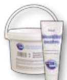
Montážní mazivo 150-250-2000 g