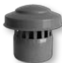
Ventilační nástavec DN 75-110