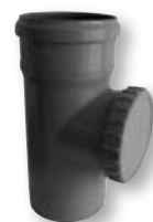
HTRE Čistící kus DN 50-75-110-125