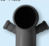
Koleno DN 110/87 dvojodbočka DN 40/30