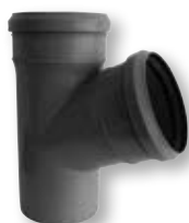
HTEA Odbočka DN 32/32-40/40-50/40-50/50 75/40-75/50-75/75-110/40 110/50-110/75-110/110 125/110-125/125 α 45°-67°30'-87°30'