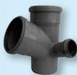
HTEP - nízká Paneláková odbočka DN 110/110/50-110/110/75 α 67°30'-87°30' Levá - Pravá