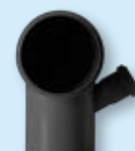
Koleno DN 110/87 odbočka DN 40/30 - pravá